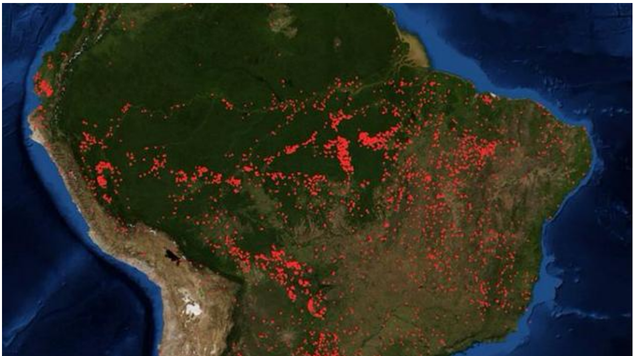
Foto de satélite

» En el infierno ardiente del Amazonas la creencia en un mundo mejor se está quemando. «